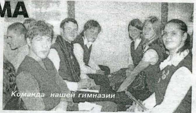
Команда нашей гимназии

Практически все районы области выставили своих участников. Игра предстала очень жаркая.